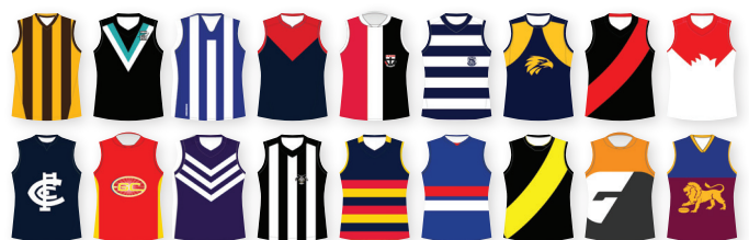
Kīit Akut AFL