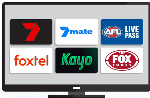
Daai pol/tuk AFL në TV ic