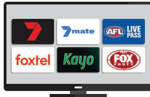
AFL-Spiele im Fernsehen anschauen