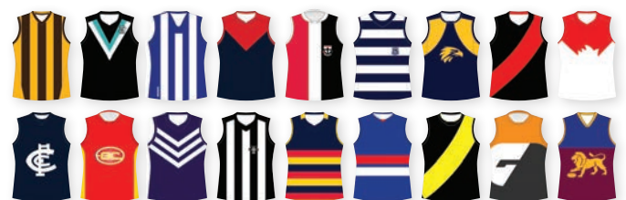
Mga kulay ng koponan (team colours) ng AFL